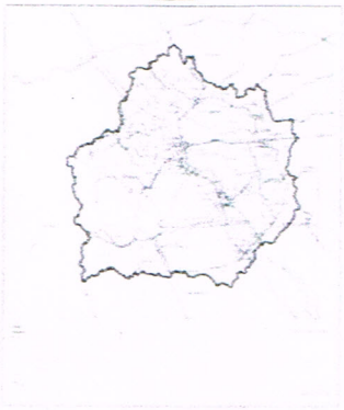
แผนที่แสดงเขตท้องที่ที่จะวาง และจัดทำผังเมืองรวม

กรมโยธาธิการและผังเมือง ได้ปิดประกาศแผนที่ แผนผัง ข้อกำหนดและรายการประกอบแผนผังของผังเมืองรวมจังหวัดกำแพงเพชร ให้ผู้มีส่วนได้เสียร้องขอแก้ไขเปลี่ยนแปลง หรือยกเลิกข้อกำหนดเกี่ยวกับการใช้ประโยชน์ที่ดินของผังเมืองรวมได้